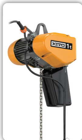
Barre de suspension