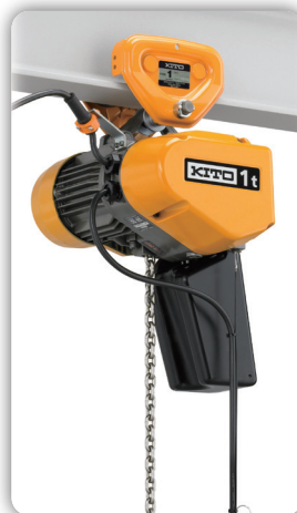
Montage sur chariot simple