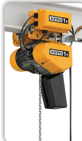
Montage sur chariot motorisé