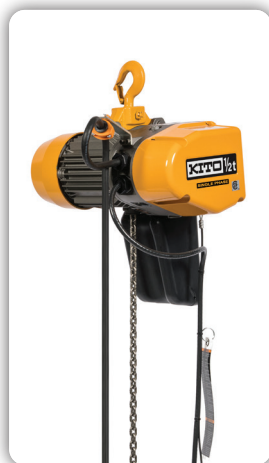
Montage sur crochet